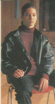
■ Täältä tyväentalon juhlasalista lähdetään ensin Finlandia-taloon ja sitten ehkä ulkomaille.

vita. Jos poika mokaa, se on vain pojan oma häpeä. Vanhemman pitää olla vanhin, hän ei saa mennä samalle asteelle lapsen kanssa. Jos hän menee, silloin on ruvettava kasvattamaan. Minun ei tarvitse kuin kerran katsoa silmiin, niin asia on hoidettu.